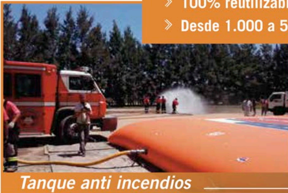
Tanque anti incendios