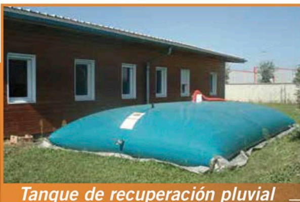
Tanque de recuperación pluvial